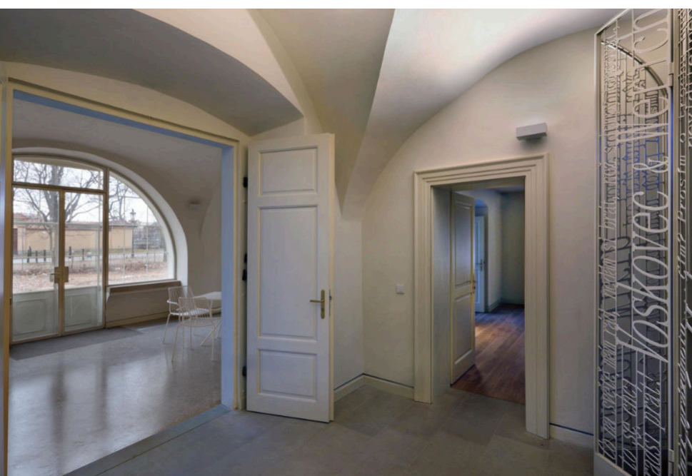
Obr.: Za Werichova života se v domě setkávala řada velkých jmen. Na jeho vyhlášený „návštěvní den“ na Štědý den sem od rána mířila řada legendárních osobností.

V roce 2002 byl dům poškozen ničivou povodní a vila začala den ode dne chátrat. Praha 1 se pokoušela najít nového nájemce celých 10 let. Až v roce 2015 přešla vila pod křídla Nadace Jana a Medy Mládkových, která v tu dobu již