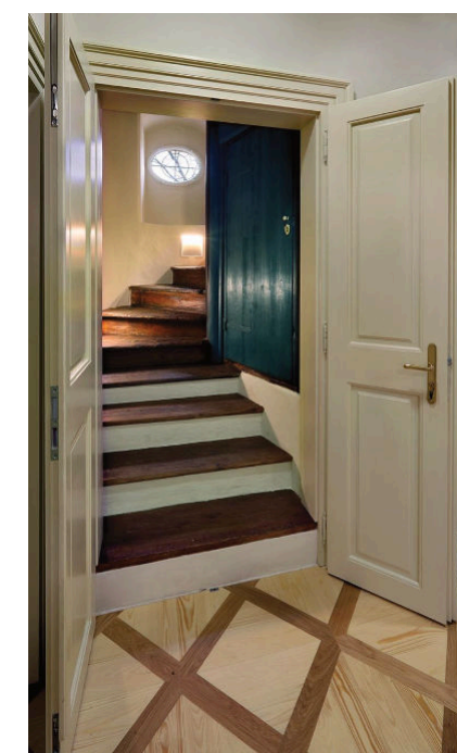
Obr.: Zatímco hlavní vstupní prostory a historické schodiště byly vyhotoveny z pískovce, někdejší salla terrena vytvořená podle Ignáce Palliardiho je zdobena podlahami z litého terazza.